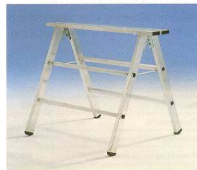
Afb. Bestelnr. 30401