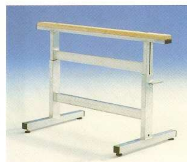
Afb. Bestelnr. 30400