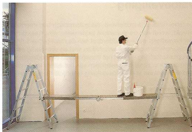
Afb. Bestelnr. 30403

Ladders zijn niet in de levering inbegrepen.