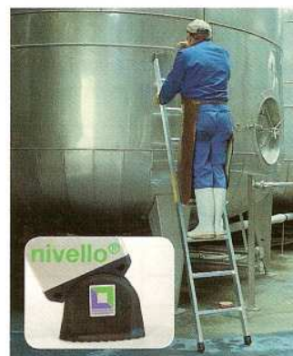
Afb. Bestelnr. 111008