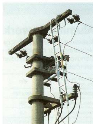
Afb. Bestelnr. 116010