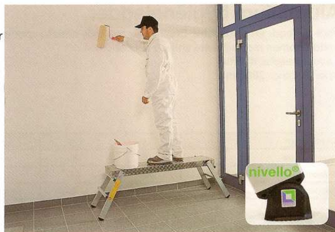
Afb. Bestelnr. 30404