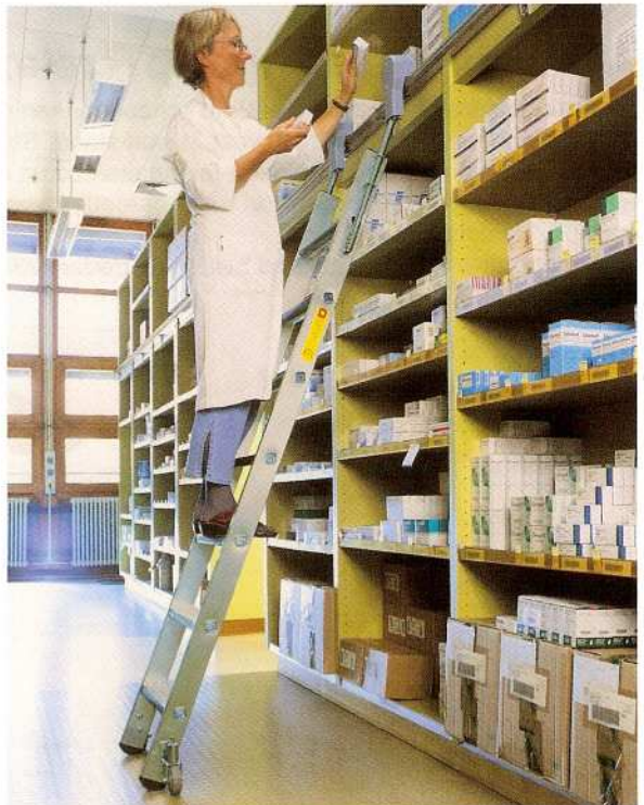
Afb. Bestelnr. 44407