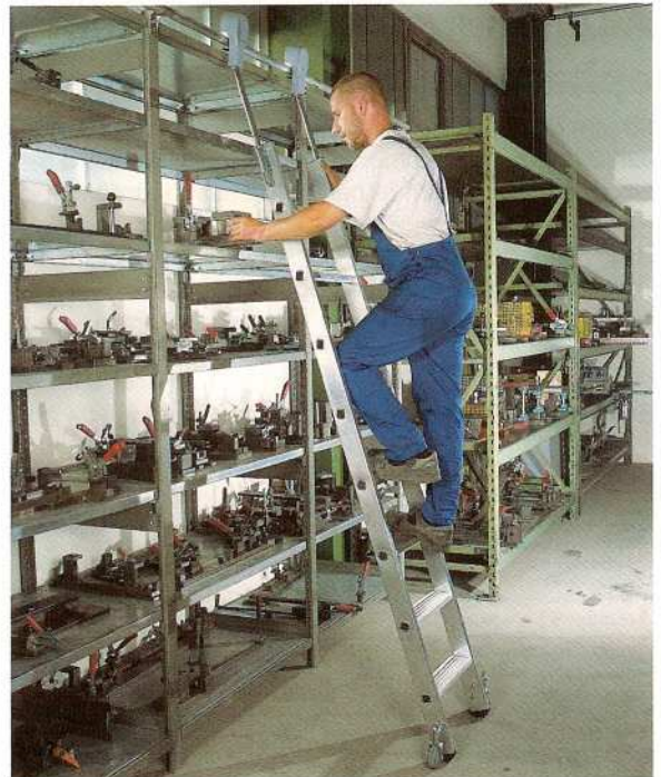
Afb. Bestelnr. 41408