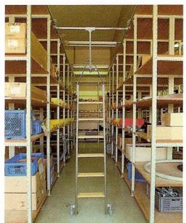
Afb. Bestelnr. 44306