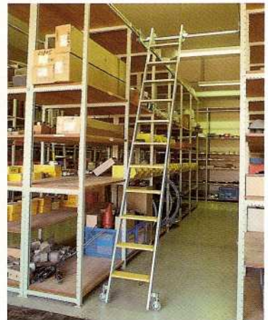
Afb. Bestelnr. 47311