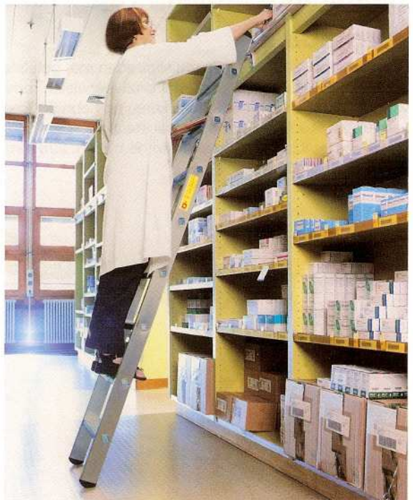
Afb. Bestelnr. 42408