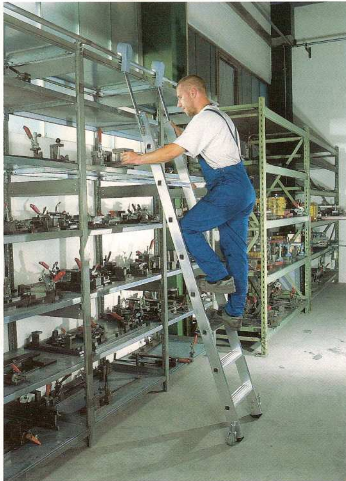
Afb. Bestelnr. 41408