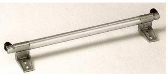
Afb. Aluminium buis met steun, eindstop rechts en links

Op een onderlinge afstand van ca. 1 meter moet een tussensteun worden geplaatst.