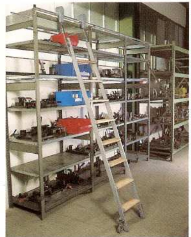
Afb. Bestelnr. 43308