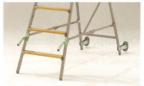
Afb. Handgrepen, hef-bokwielen en spreidbeveiliging