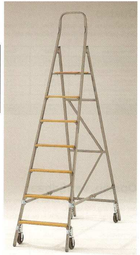
Afb. Bestelnr. 39307