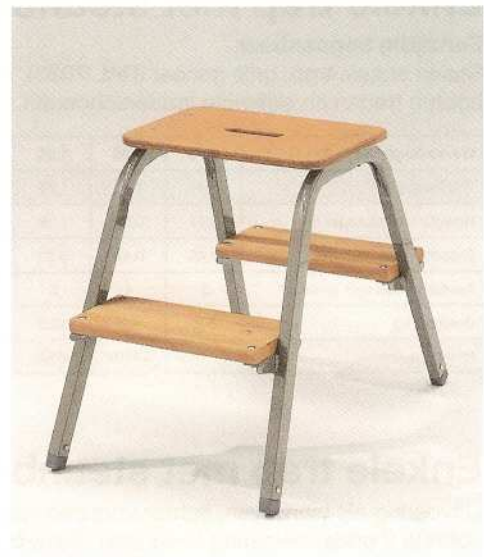
Afb. Bestelnr. 39002