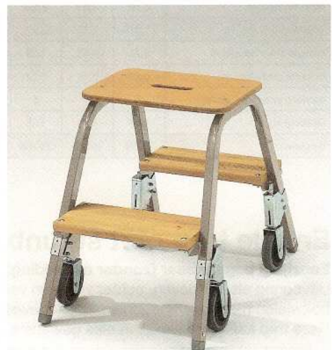
Afb. Bestelnr. 39012