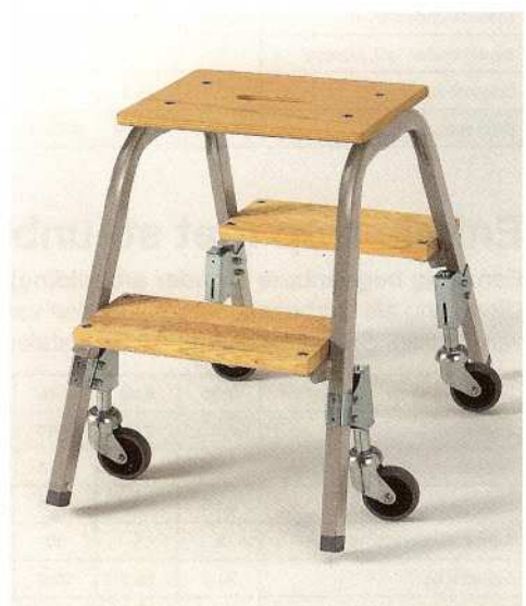
Afb. Bestelnr. 39022

Wordt in delen aangeleverd, incl. montage handleiding.