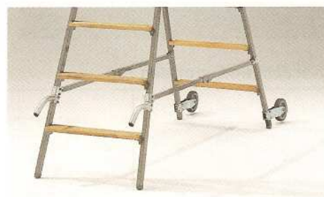
Afb. Handgrepen, hef-bokwielen en spreidbeveiliging